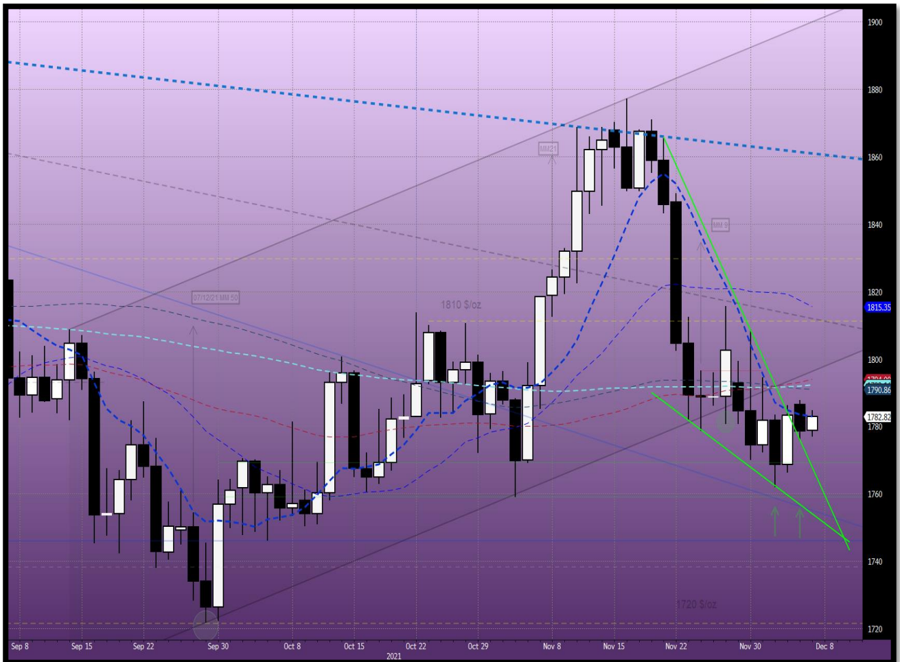
Fig.1- XAU Usd/oz GRAFICO GIORNALIERO