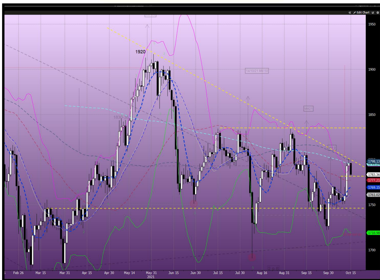
Fig.2- XAU Usd/oz GRAFICO GIORNALIERO

Molto negativa invece sarebbe la perdita del triplice minimo di 1670$/oz.