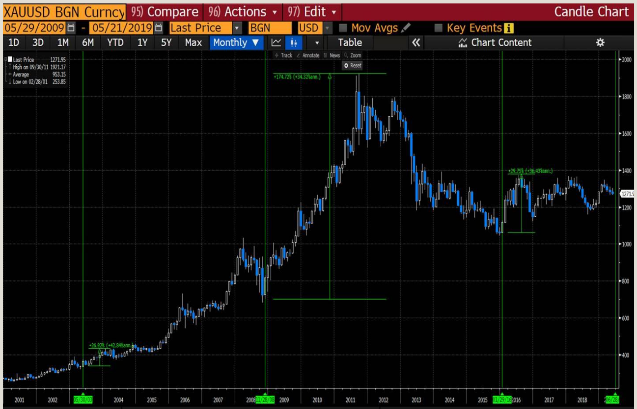
Fig.2 Xau/usd monthly chart