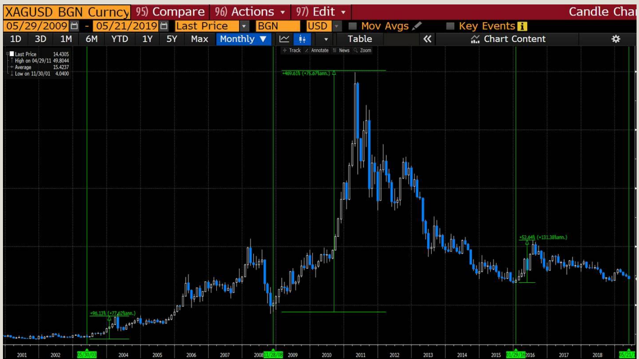
Fig.3 Xag/usd monthly chart