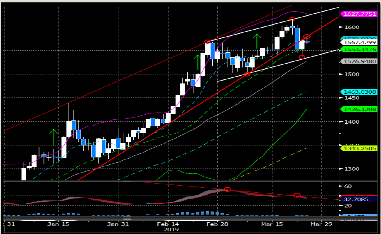
Fig.1- PD Usd/oz daily chart

Il quadro tecnico attuale del palladio ha connotati ribassisti .