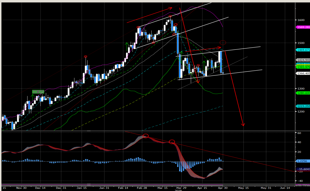
Fig.1- PD Usd/oz daily chart

Dopo il recente sell-off dai massimi di area 1600 $/oz fino ai minimi di area 1300 $ il palladio ha avuto un periodo di normalizzazione.