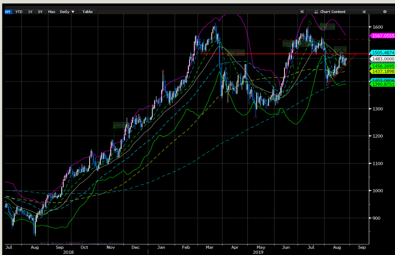
Fig.1- PD Usd/oz DAILY chart

Nonostante la risalita del prezzo dai minimi di inizio Agosto, il target ribassista del palladio non sembra essere stato raggiunto.